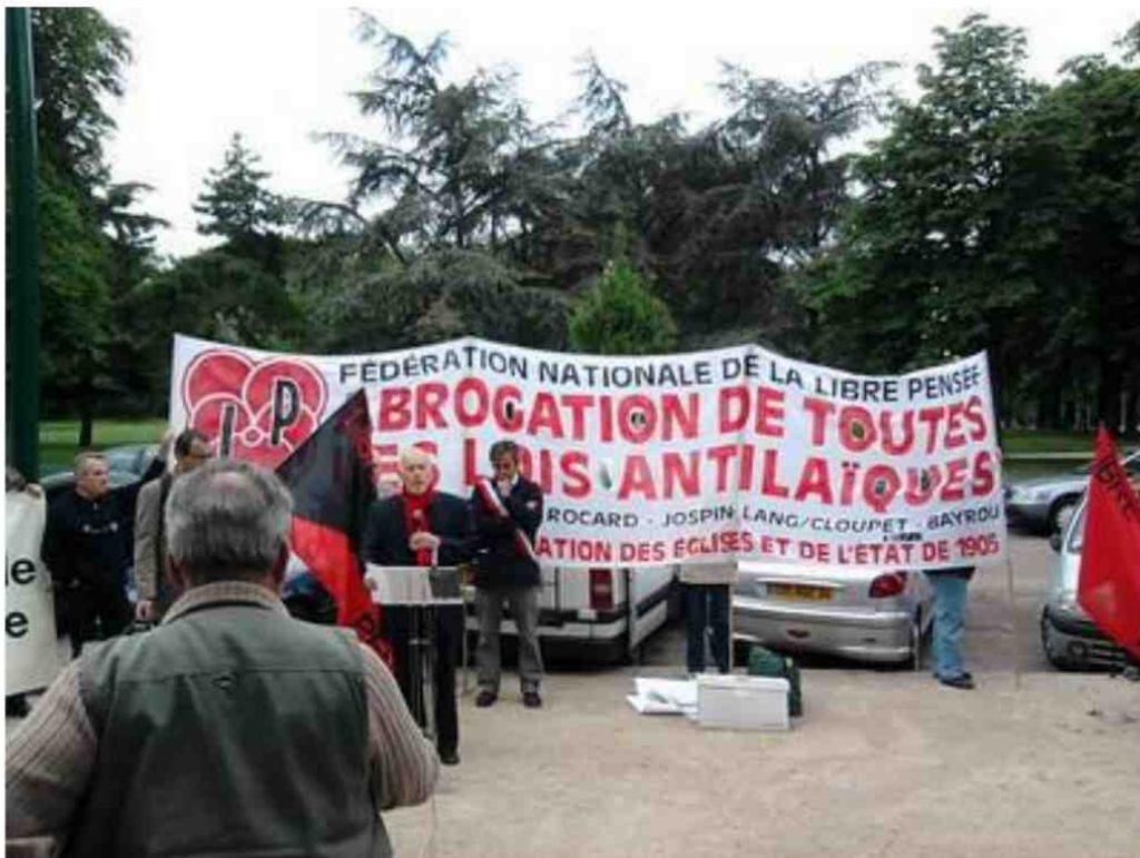
Rassemblement pour célébrer le Serment de Vincennes de 1960 en juin 2010 avec Marc Blondel